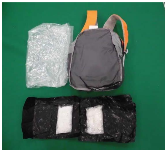
リュックサック内に隠匿

台湾から到着した海上小包郵便物 13 個から、リュックサック 178 個の中に隠匿された覚醒剤約 35 キログラムを発見・摘発しました。