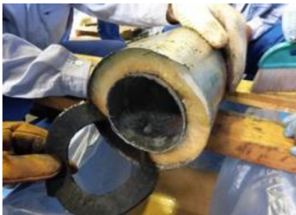
スクラップ内に隠匿

メキシコ合衆国から到着した海上コンテナ貨物から、金属スクラップに隠匿されていた覚醒剤約230キログラムを発見、摘発しました。