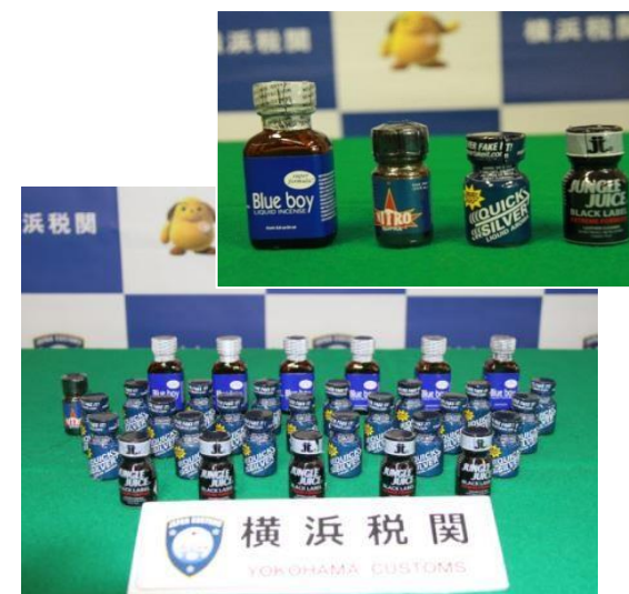
摘発された指定薬物を含有する液状物

ハンガリー他 4 か国から到着した郵便物から指定薬物である亜硝酸イソブチル等を含有する液状物 103 本(約 954 グラム)を摘発しました。