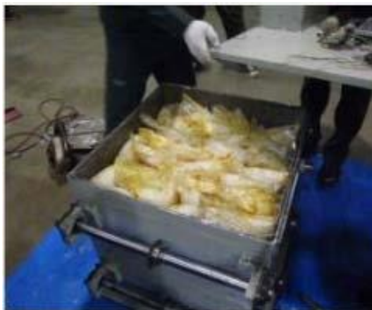
小石運搬機内に隠匿

中華人民共和国から到着した海上貨物から、小石運搬機に隠匿されていた覚醒剤約150キログラムを発見、摘発しました。