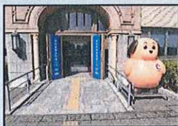
入口の目印はカスタム君！