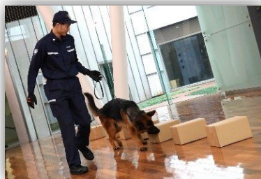
麻薬探知犬のデモンストレーション