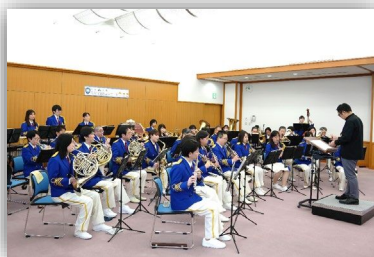
税関音楽隊の演奏会