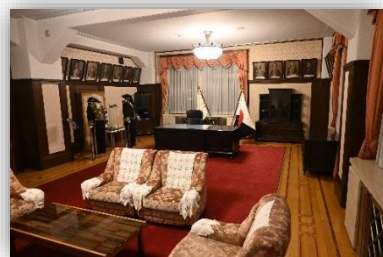
3階保存室 特別公開