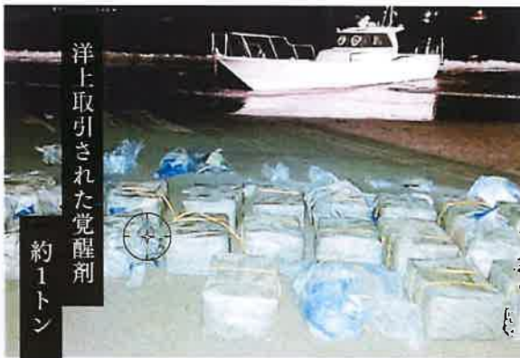
洋上取引された覚醒剤