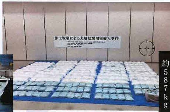
洋上取引による大量覚醒剤密輸入事件