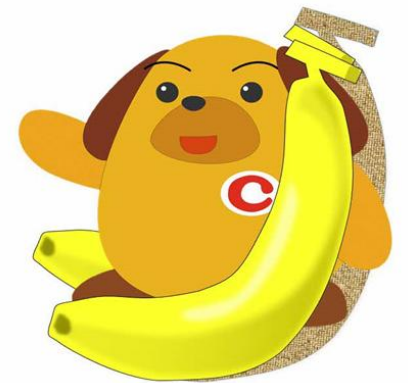
門司税関ご当地カスタム君