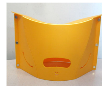
折り畳み椅子 [特許権]