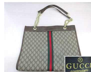
ハンドバッグ [商標権]