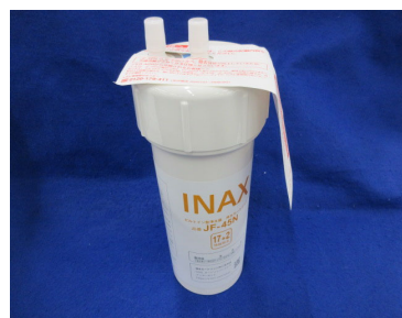
浄水器用カートリッジ [商標権]