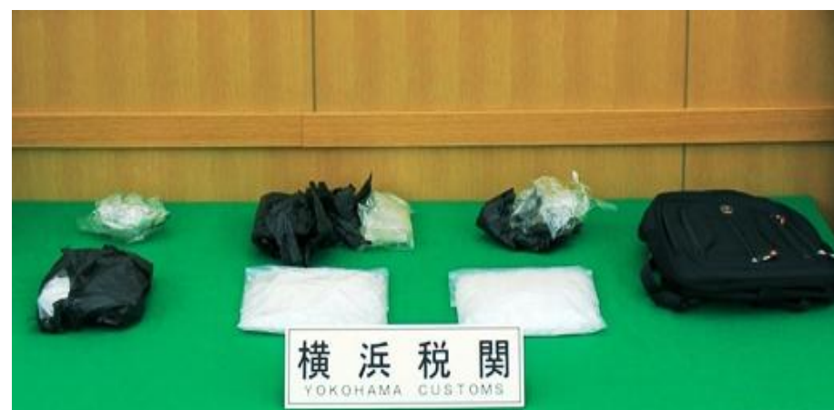
リュックサック内に隠匿

中国から入港した外国貿易船の乗組員から、覚醒剤約3kgを摘発しました。覚醒剤は、乗組員が携行していたリュックサック内に隠匿されていました。