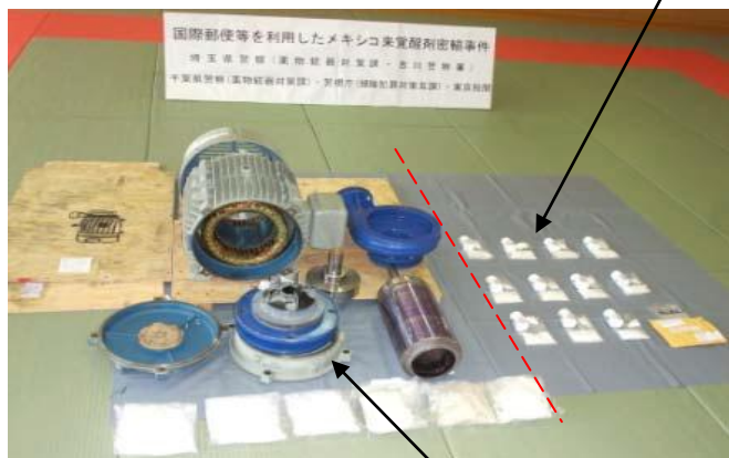
覚醒剤が隠匿されていたポンプ

(平成24年1・2月、東京税関成田航空貨物出張所 及び成田南部航空貨物出張所 摘発)