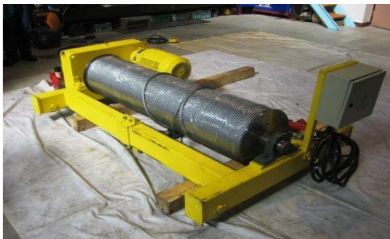
覚醒剤が隠匿されていたウインチ

香港から到着した海上コンテナ貨物から、覚醒剤約44kgを摘発しました。 覚醒剤は、ウインチ内部に隠匿されていました。