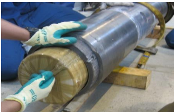
ウインチドラム内部に隠匿