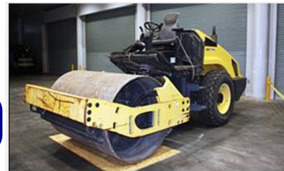
覚醒剤が隠匿されていたロードローラー

オランダから到着した海上コンテナ貨物から、覚醒剤約109kgを摘発しました。 覚醒剤は、ロードローラーのローラー内部に隠匿されていました。