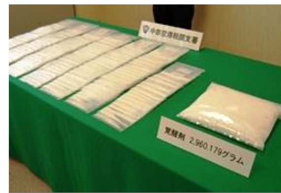
隠匿されていた覚醒剤

ドイツから到着したドイツ人航空機旅客から覚醒剤約3kgを摘発しました。覚醒剤は、リュックサックの背当部の二重工作及びマカダミアナッツの袋に入れ同リュックサック底に隠匿されていました。