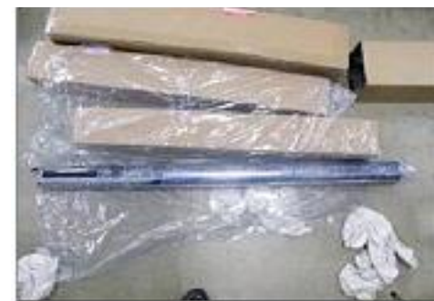
プロペラシャフト内に隠匿

アメリカから到着した航空貨物から、大麻草約40kgを摘発しました。大麻草は、自動車部品のプロペラシャフト内に隠匿されていました。