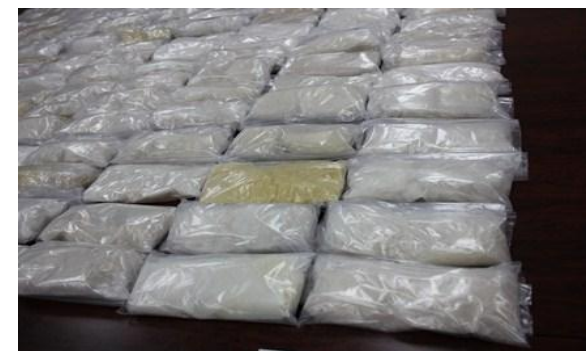
隠匿されていた覚醒剤