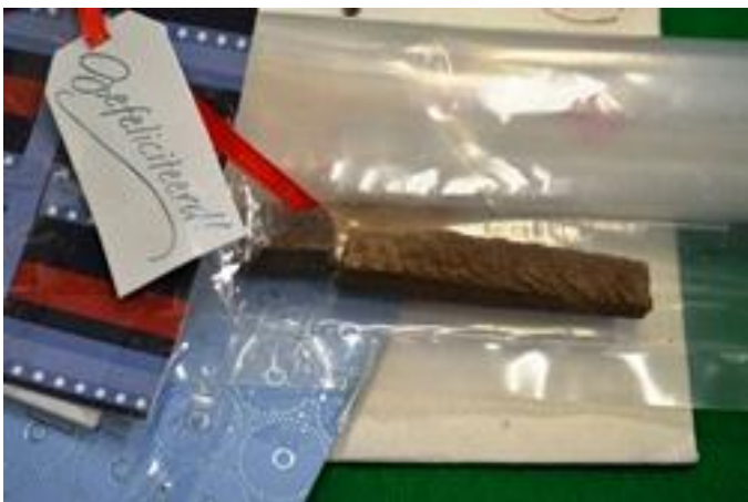
隠匿されていた大麻樹脂