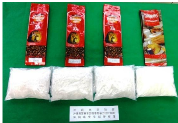
コーヒー豆の袋内に隠匿

ケニアから韓国を経由して到着した日本人航空機旅客から覚醒剤約2kgを摘発しました。覚醒剤は携帯品内のコーヒー豆の袋内に隠匿されていました。