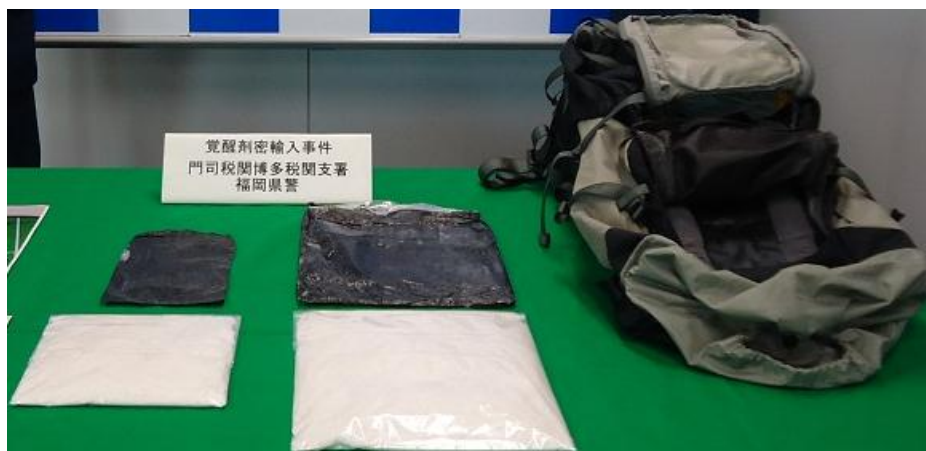
リュックサック背部に隠匿

韓国から到着した定期高速船旅客から、覚醒剤約2kgを摘発しました。覚醒剤は、旅客が携行していたリュックサック背部に隠匿されていました。