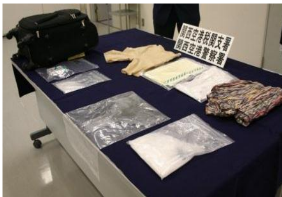
身辺及びキャリーケース内紙箱に隠匿

中国から到着した日本人航空機旅客から覚醒剤約500gを摘発しました。覚醒剤は、身辺及びキャリーケース内の紙箱に隠匿されていました。