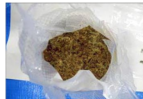
隠匿されていた大麻草