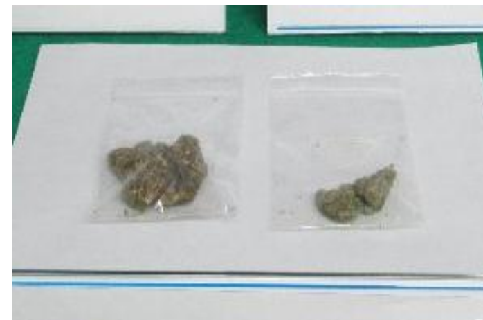
隠匿されていた大麻草