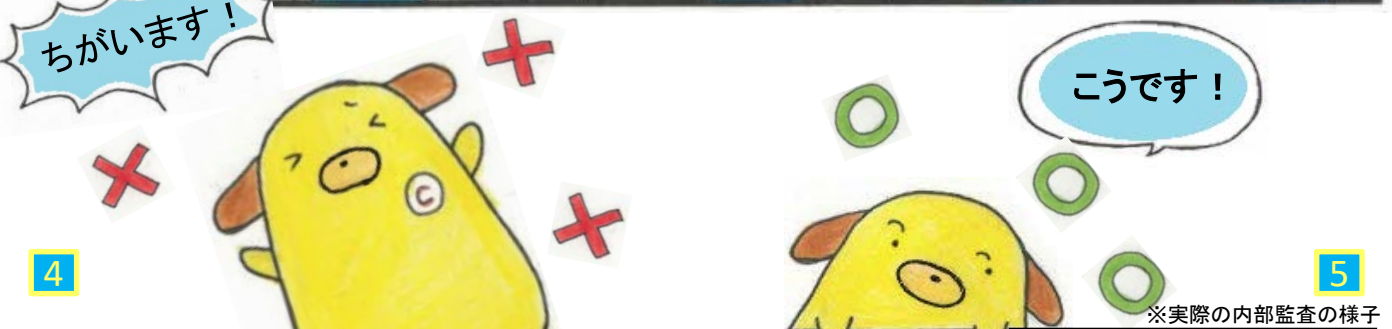
※実際の内部監査の様子