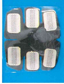
トレーニング機器 [意匠権]