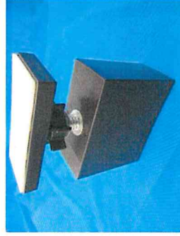
柱材支持具 [意匠権]

東京税関では、海上貨物は3月7日（月）から3月20日（日）まで、航空貨物・郵便物は3月7日（月）から3月13日（日）までを「知的財産侵害物品取締強化期間」として取締りを強化しますので、ご理解とご協力をお願いします。