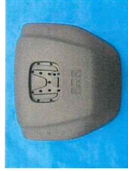
エアバッグカバー [商標権]