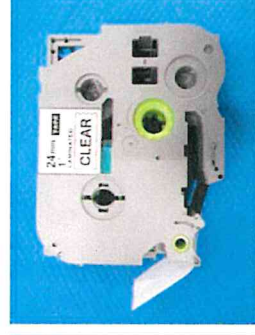
テープカセット [特許権]