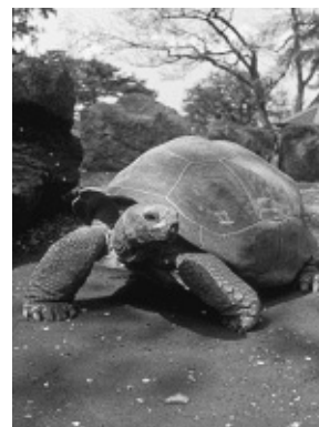
アルダブラゾウガメ