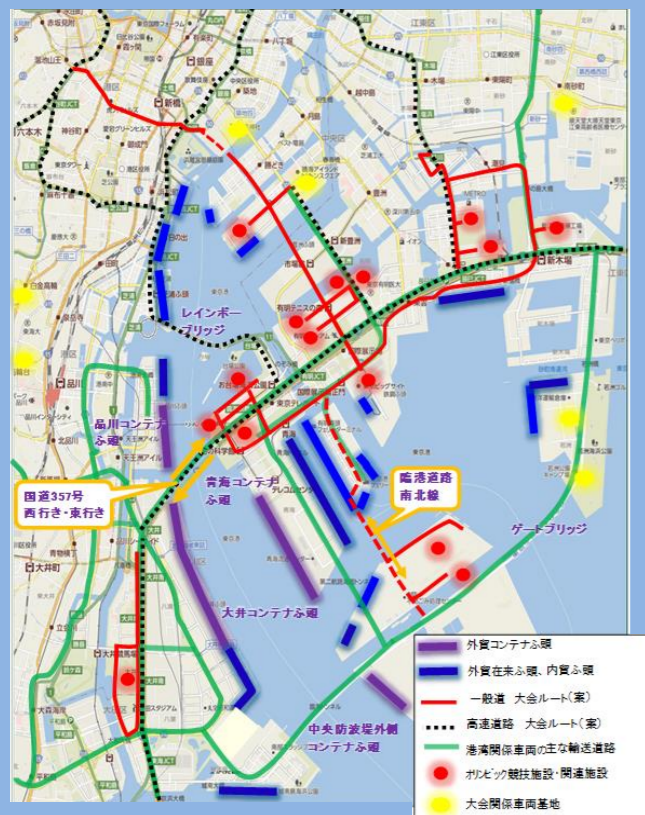
〈東京2020大会関連施設と東京港のふ頭位置図〉