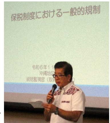
【開会の挨拶：豊川事務局長】

保税研修会中級編は2年前から終日の研修としており、午前中は沖縄地区税関監視部取締機動部門職員による「保税制度における一般的規制」及び同保税地域監督官部門職員による「保税制度の変遷」、「記帳義務の注意点」や「国際物流の動向を踏まえた保税制度のあり方について」及び「内部監査における監査手法と関税法48条の処分、非違事例等」、午後はNACCS九州事務所の職員を講師に、「NACCS業務海上航空保税研修（中級編）」及び「第7次更改に係る詳細仕様等」についてなど多岐にわたり講義して頂きました。