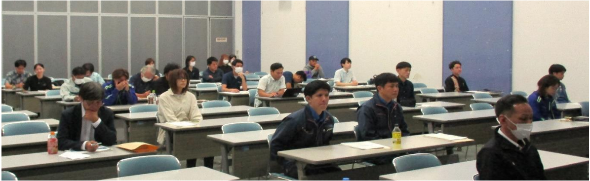
【熱心に講義に耳を傾ける受講生の皆さん】👉

事前の参加申込者は25社51名でしたが、当日は若干減ったものの25社41名の会員の皆様が受講していただきました。