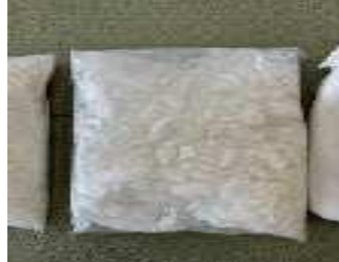
(令和6年4月、横浜税関)