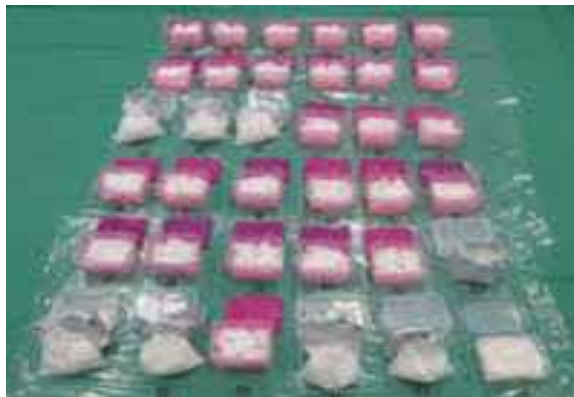
(令和5年9月、東京税関)