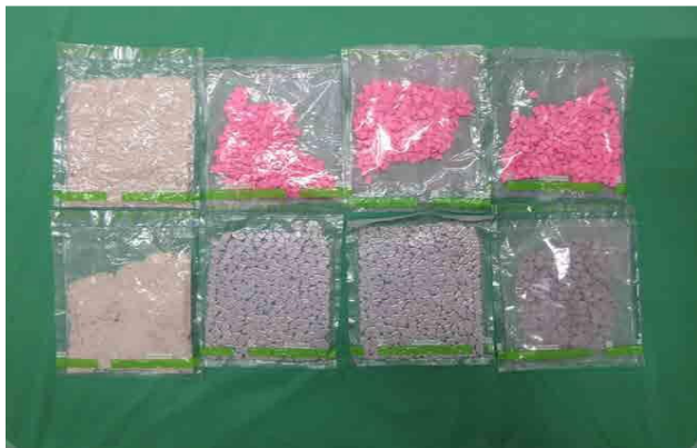
(令和6年3月、東京税関)