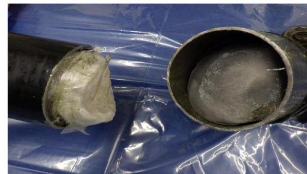
(令和6年4月、大阪税関)

アメリカから到着した航空貨物から、プロペラシャフト内に隠匿された覚醒剤約3キログラムを摘発しました。