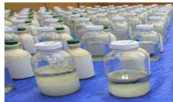
(令和5年6月、横浜税関)

カナダから到着した海上貨物から、メープルシロップに隠匿された覚醒剤約116キログラムを摘発しました。