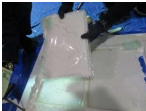
(令和5年3月、東京税関)