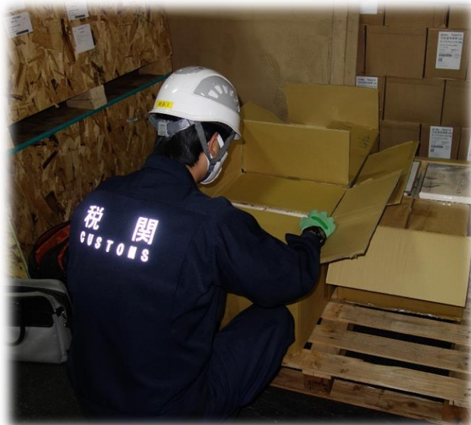
輸入貨物・国際郵便物検査