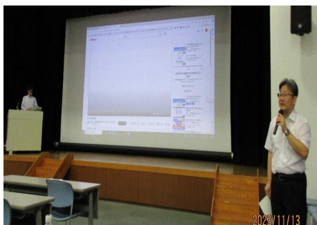
(挨拶を行う、宮金 NACCS 九州事務所長)