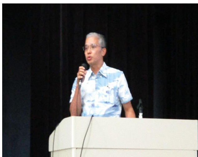
(許可の条件、台帳記帳、更新手続き等の説明)