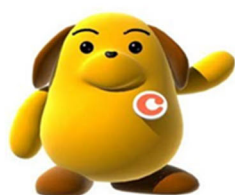
税関イメージキャラクター カスタム君

税関ホームページ http://www.customs.go.jp/nagoya/