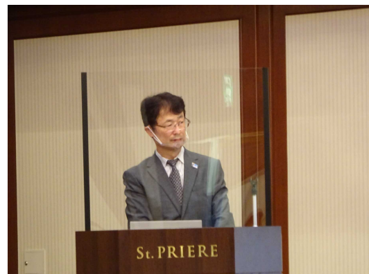
【奥田税関長による講演】