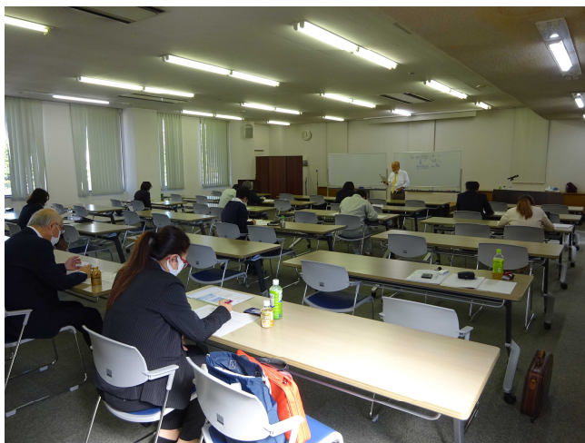
[ソーシャルディスタンスで緊張の中、講座が始まりました]

ミニ演習では、商社勤務時の海外駐在で培われた取引を有利に進めていくための数々のテクニックを様々な英語表現で披露、また、随所に小話なども交えて英文での実践的なメール作成に取り組みました。