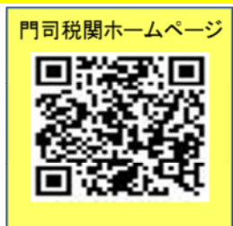
門司税関ホームページ