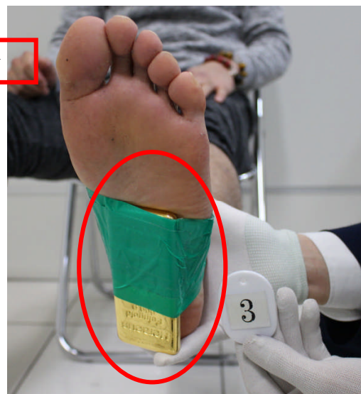
←拳銃 税関において摘発した ↑金地金