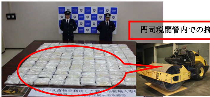
門司税関管内での摘発

金の密輸、覚醒剤等の薬物、拳銃、テロが疑われる不審物 密輸 に関する 不審な話 や うわさ を耳にされたら、 税関へご一報願います。