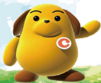
「税関イメージキャラクター」 カスタム君

財務省・税関は、明治5年11月28日（1872年）、今日の税関の前身である運上所（うんじょうしよ）から名称を「税関」と改められて以来、日本の貿易の健全な発展と安全な社会の実現に大きな役割を担い、2022年に税関発足150周年を迎えます。 このたび税関発足150周年を記念し、特別企画として、我が国の将来を担う小中学生に対して税関や貿易等をテーマとした絵画の制作を通じて、税関の役割や私たちの生活に欠かせない国際貿易等について関心をもっていただくことを目的として「小中学生絵画コンクール」を実施することとなりました。