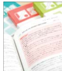
難解な法令をわかりやすく解説したテキストです。

テキストを編集するにあたって私たちが掲げたテーマは、「初学者でもスムーズに理解できる」ということ。フローチャートなどを多用し、難解な内容もかみくだいて繰り返し説明しているのもそのためです。またテキストには学習到達目標を設定し、自分の進捗度を意識しながら学習を進められるようになっています。