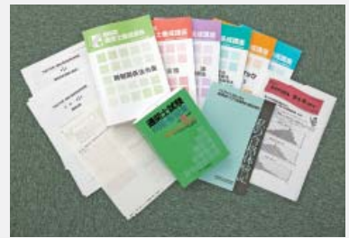
テキストと配付教材(平成25年度版)

本協会の『平成25年度通関士養成通信教育講座』、『平成25年度通関士養成ビデオ通信教育講座』、『平成25年度通関士養成講習会』のいずれかを受講された方を対象として、再受講料金を設定しています。また、上記再受講料金の適用対象外の方も、2014年2月14日(金)までにお申しいただきますと、早割料金で受講することができます。