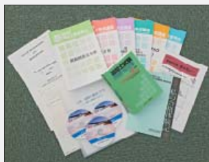
テキストと配付教材(平成25年度版)