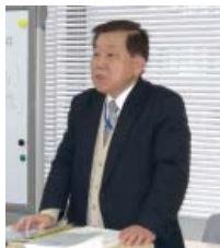
指導経験豊かなベテラン講師が多数在籍しています。

本講座のテキストや問題集を監修しているのは、主に税関研修所の元教官。試験対策の指導実績が豊富で、通関実務にも詳しいベテランぞろいです。スクールによっては、通関士試験の合格者が講師を務める場合もありますが、本協会の講師陣はいわば「先生の先生」。指導力には確たる自信を持っています。