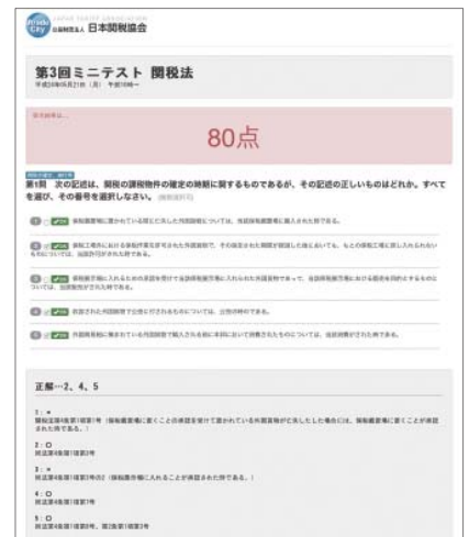
オンラインミニテスト

ヒアリング調査の結果をもとに、経験豊かな講師陣が今後の学習の進め方や改善点などについて、2回にわたって懇切丁寧にアドバイスします。