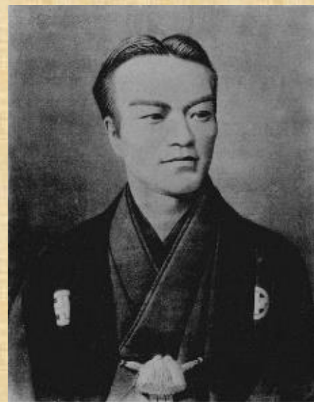
初代大阪税関長 五代友厚