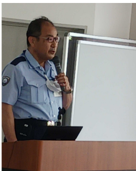
【山崎支署長開催ご挨拶】