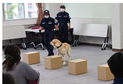
【麻薬探知犬：この箱が匂うよ！】