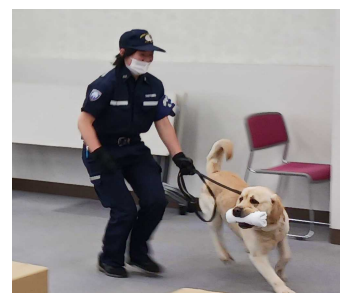
【ご褒美で遊びました】