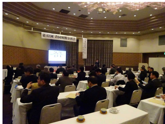
〔熱心に聴講される皆さん〕