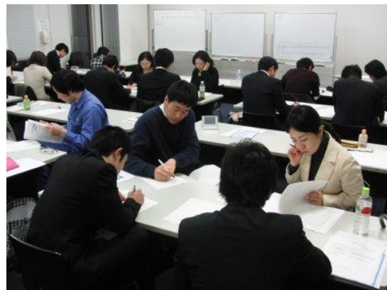
【真剣に取り組まれるグループ演習】