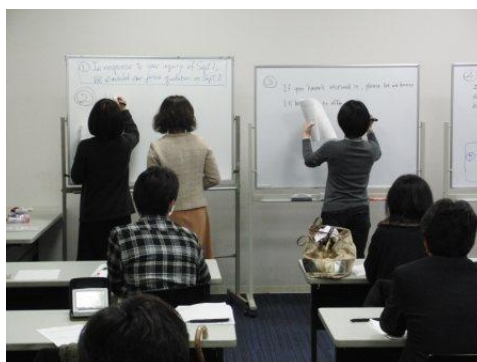
【グループ演習の結果発表】