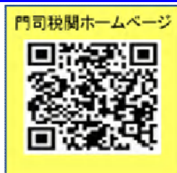
門司税関ホームページ