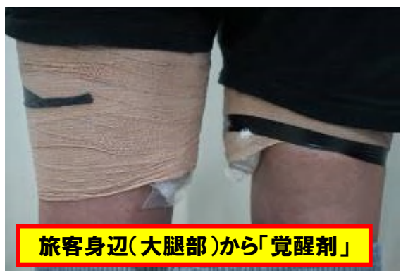
旅客身辺(大腿部)から「覚醒剤」