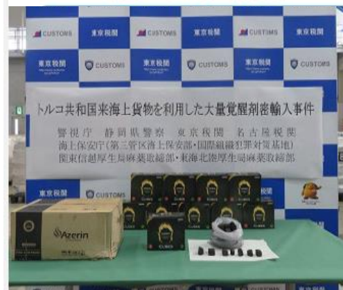
(令和3年11月、東京税関)