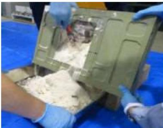
(令和3年8月、東京税関)