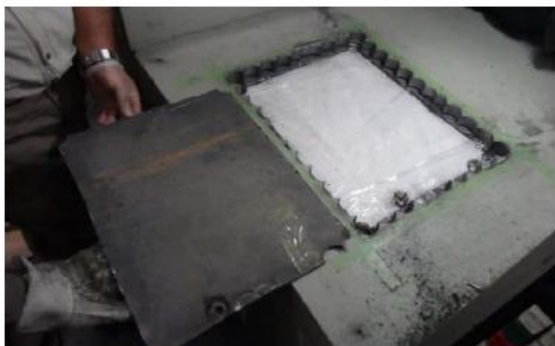
(令和3年4月、横浜税関)