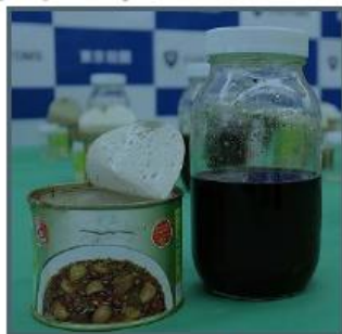
(令和4年1月、東京税関)

トルコ共和国から到着した航空貨物から、食料品缶詰に隠匿された液状覚醒剤5,638.7グラムを摘発しました。