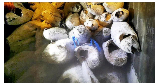
マグロの体内に隠匿されていた覚醒剤