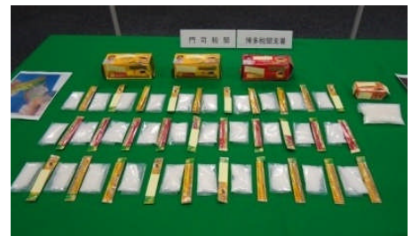
コーヒー等に隠匿されていた覚醒剤