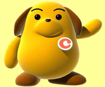
税関イメージキャラクター カスタム君

24日(土)～28日(水) 10:00～17:00 (24日は13:00～17:00)