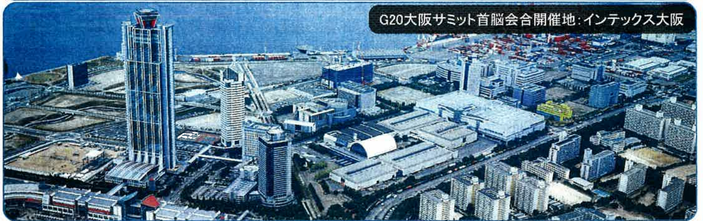
G20大阪サミット首脳会合開催地：インテックス大阪

このたびの取締り及び検査強化の趣旨をご理解いただき、ご協力をお 願いいたします。