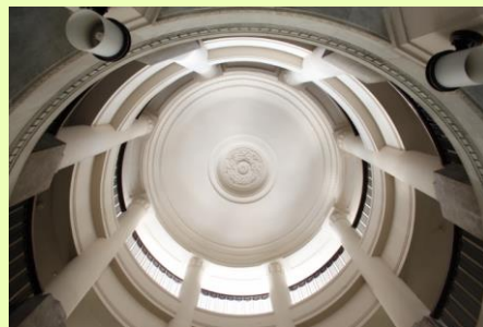
エントランス吹き抜け