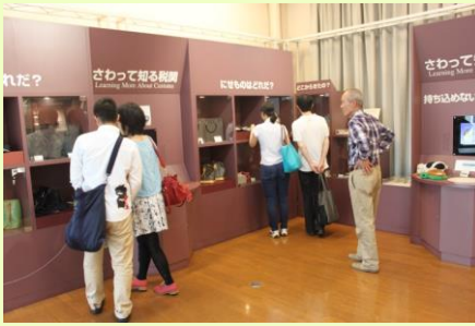
ボランティアガイドが展示品等をご案内