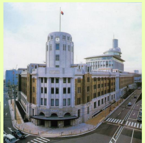
神戸税関本関外観