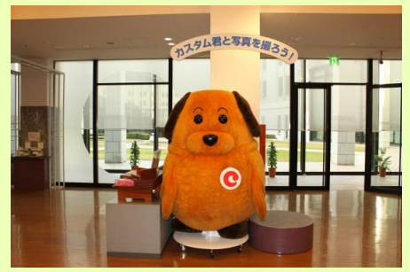
広報展示室の風景