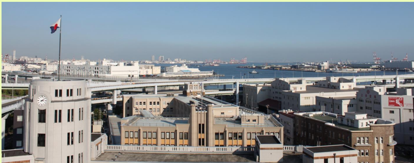
庁舎屋上からの風景